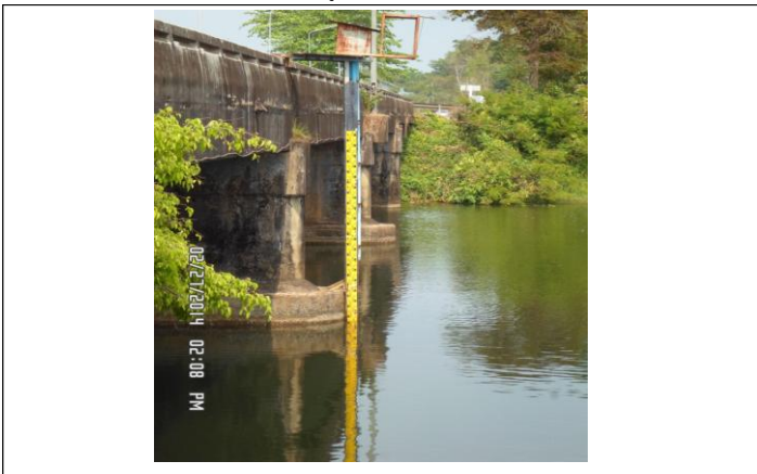
รูปเหนือแนวสำรวจ