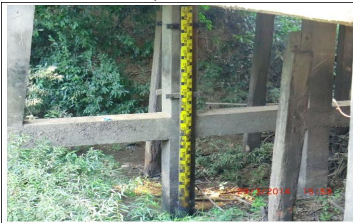
รูปเหนือแนวสำรวจ