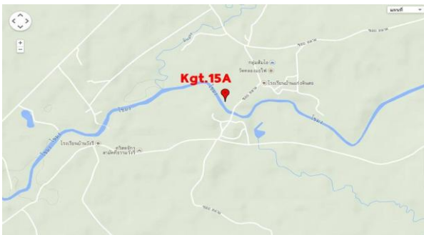
ตำแหน่งที่ตั้งสถานีบน Google Map