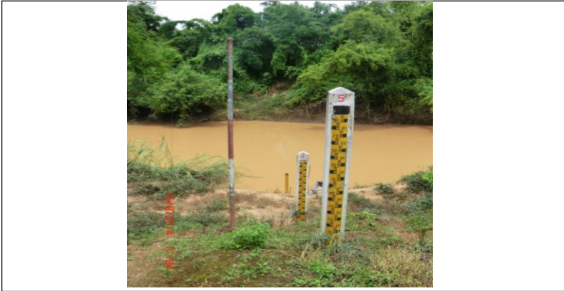
รูปเหนือแนวสำรวจ